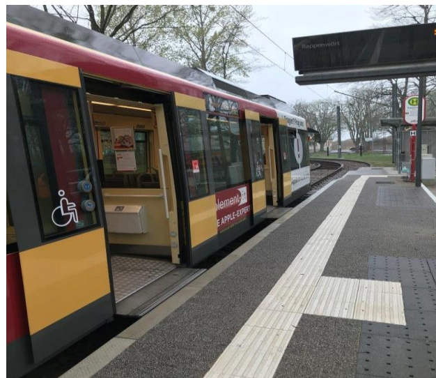
Abbildung 3: Haltestelle Rappenhörth taktiler Einstiegsfeld