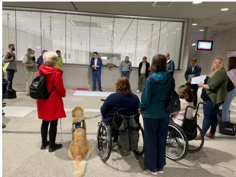
Abbildung 4: Vertreterinnen und Vertreter des BMB beim Treffen im U-Bahnhof Marktplatz.

Auch die Klagen zum Kontrast der taktilen Leitstreifen, der aus Nutzersicht in den Verteilerebenen in einzelnen Haltestellen nicht ausreichend ist, wurde angesprochen. Die KASIG prüft mögliche Änderungen.