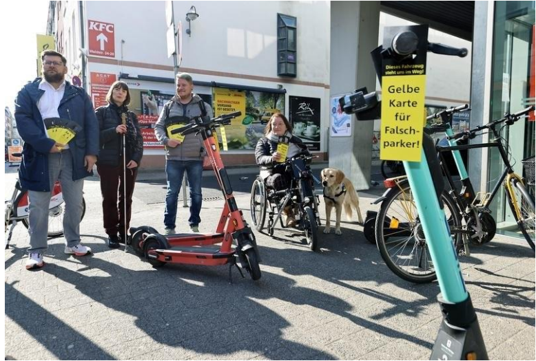
Abbildung 6: Gelbe Karte: Vertreter des Karlsruher Beirats für Menschen mit Behinderung weisen mit der Aktion auf die Gefahren von abgestellten E-Scootern hin.

Seine große Hoffnung ruht auf dem kürzlich vom Verwaltungsgericht Münster getroffenen Urteil. Darin verpflichtet das Gericht die Stadt, schnell klare Regelungen für den Umgang mit E-Scootern zu finden, die ein Hindernis für andere Menschen darstellen. Für den März plant Münster, den Leihfirmen eine Sondernutzungserlaubnis für öffentliche Flächen zu erteilen, sodass Nutzer die Scooter an ausgewiesenen Stellen abstellen können. „Das Urteil ist die Initialzündung in Deutschland“, sagt Budnik. Er schlägt vor, Abstellflächen für E-Scooter etwa neben bereits bestehenden Fahrradstellplätzen auszuweisen.