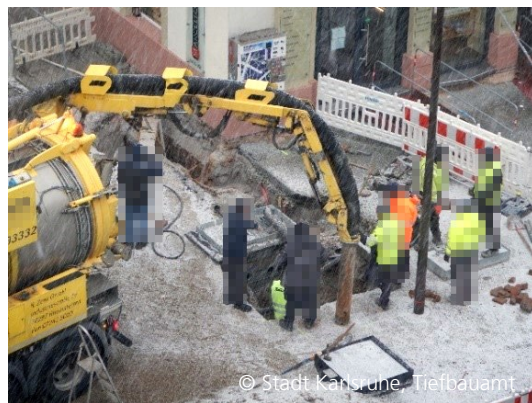
Abbildung 6: Winterarbeit bei Schneesturm