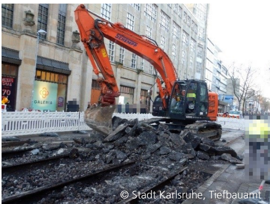
Abbildung 7: Rückbau der Gleisanlagen