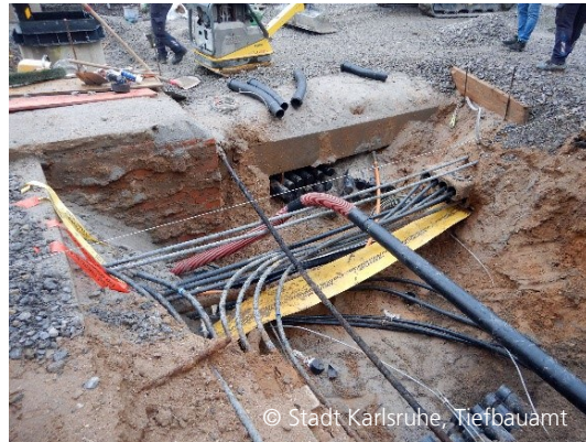
Abbildung 4: Detailreiche Leitungsverlegungen