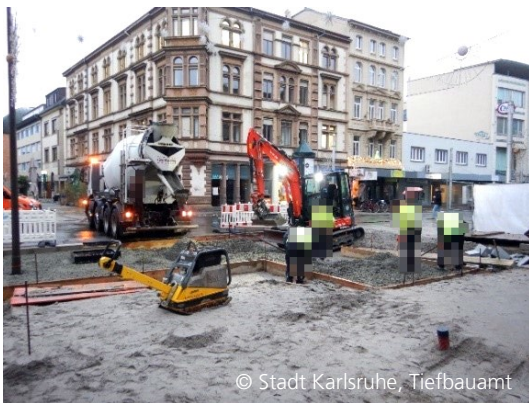
Abbildung 5: Herstellung der Drainbetontragschicht