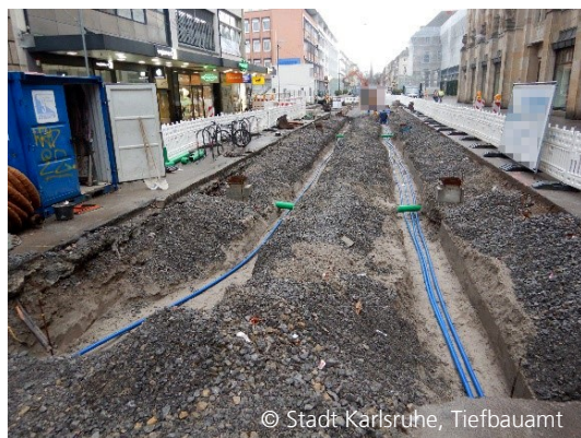
Abbildung 8: Leitungsbau für Baumbewässerung