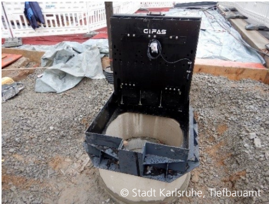
Abbildung 3: Herstellung der Senk-Elektranten

Trotz der schwierigen Witterungsverhältnisse zu Jahresbeginn konnten wichtige Arbeitsschritte für die spätere Nutzung der Kaiserstraße umgesetzt werden. So wurden umfangreiche Leitungsbauarbeiten auf sehr engem Raum (Abbildung 4) ausgeführt und sogenannte Senk-Elektranten als unterirdische Versorgungsstationen installiert.