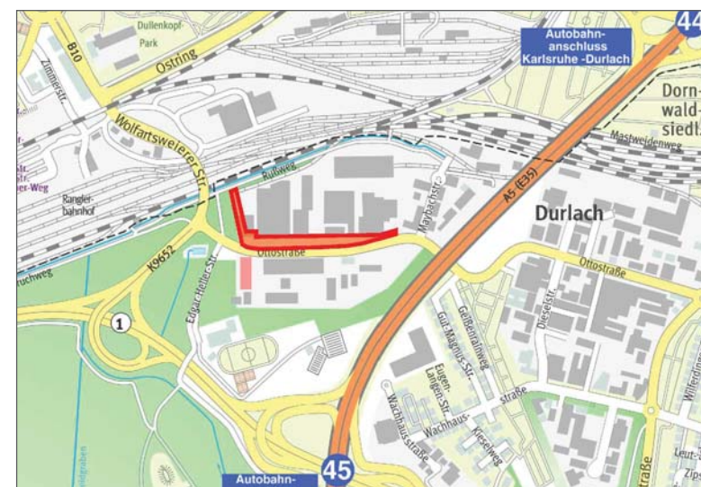
Stadtplanausschnitt M = 1:20.000