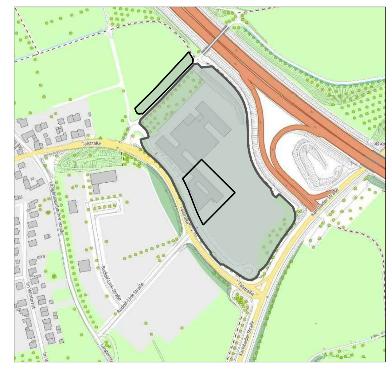
Stadtplan Ausschnitt M. 1:2500