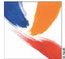
Freundeskreis Badisches Malerdorf Grötzingen e.V.

Die Hottschek-Hexen sind mit ihrem Getränkestand dabei.