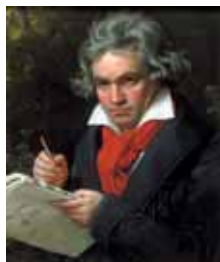
Joseph Karl Stieler, Portrait von Ludwig van Beethoven