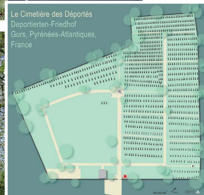
Le monument aux morts Denkmal zur Erinnerung an die Opfer

nerung an die Opfer errichtet. Der zunächst noch gepflegte Friedhof verwilderte aber im Laufe der Jahre zusehends. Im Jahre 1957 ergriff der Karlsruher Oberbürgermeister Günther Klotz nach der Veröffentlichung eines Zeitungsberichts über den Verfall des Friedhofs die Initiative zu dessen Instandsetzung und Pflege. Unterstützt wurde er vom Oberrat der Israelitischen Religionsgemeinschaft Baden. Die badischen Städte, Gemeinden und Kreise, aus denen jüdische Bürger nach Gurs deportiert und dort begraben wurden, brachten durch eine Spendenaktion die Gesamtkosten der Neugestaltung auf. Der Friedhof, den die Gemeinde Gurs dem Oberrat für 99 Jahre verpachtet hatte, wurde am 26. März 1963 feierlich eingeweiht.