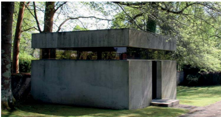
Salle de mémoire avec la liste des sépultures, érigée en 1972 par les communes de Bade Von den badischen Gemeinden im Jahre 1972 errichtete Gedenkhalle mit dem Gedenkbuch der Toten

In der Nachkriegszeit hatte der Verband der jüdischen Gemeinschaften der Basses-Pyrénées schon im Jahr 1945 ein Denkmal zur Erin-