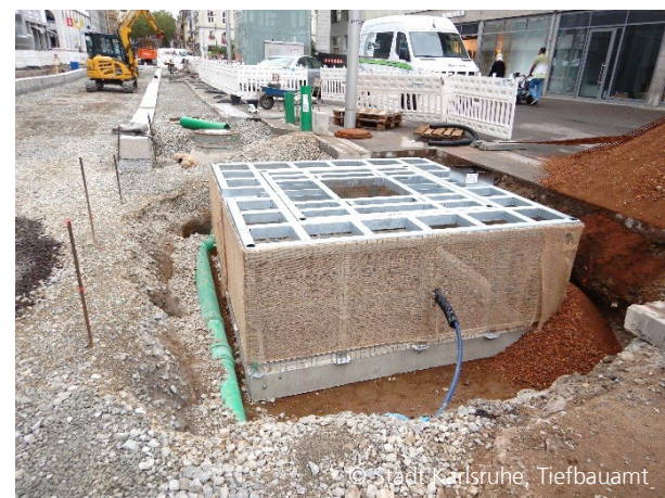
Abbildung 6: Baumquartiere in der Kaiserstraße