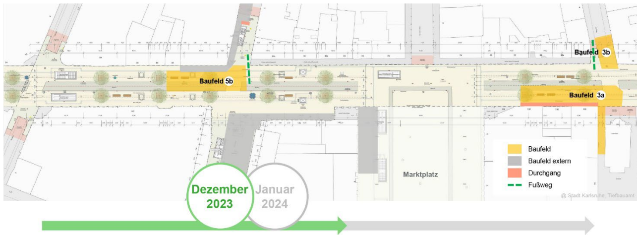
Abbildung 1: Baufelder Jahreswende 2023/2024

Voraussichtlich in der zweiten Kalenderwoche 2024 werden die Arbeiten in den aktuellen Baufeldern wieder aufgenommen. Ende Januar oder spätestens Anfang Februar sollen dann die weiteren Abschnitte, wie in den Abbildungen 1 und 2 dargestellt, eingerichtet werden.