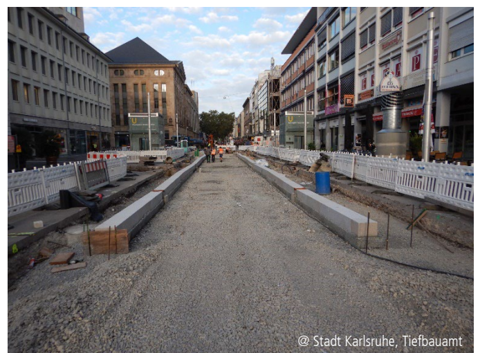
Abbildung 3 und 4: Leitungsbau Gas und Wasser sowie Entwässerungsrinnen als Begrenzung des zukünftigen Zierbands