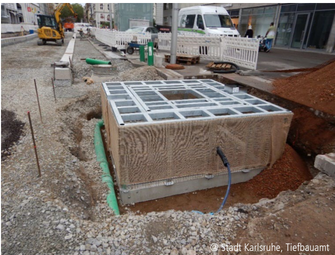
Abbildung 2: Baumquartier, Baufeld 4

Gleichzeitig erfolgte die Herstellung der künftigen Baumquartiere (siehe Abbildung 2). Diese sogenannten Wurzelkäfige werden mit Baumsubstrat verfüllt und unterstützen die optimale Entwicklung der neuen Bäume. Die obere Schutzabdeckung verhindert Belastungen auf den Wurzelbereich und sorgt für eine gute Lastabtragung des Verkehrsaufkommens in den Untergrund. Nebenbei erfolgten die Integration der Versorgungsanschlüsse und Wartungseinrichtungen.