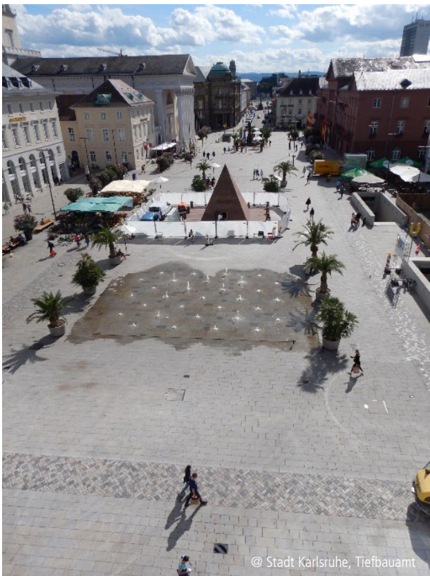
Abbildung 5: Marktplatz, Ende September 2023

Große Teile wurden bereits während der Baumaßnahme Neugestaltung des Marktplatzes hergestellt, im Rahmen der Neugestaltung der Kaiserstraße wurden nun die Flächen bis an die nördlich angrenzenden Gebäude ergänzt.