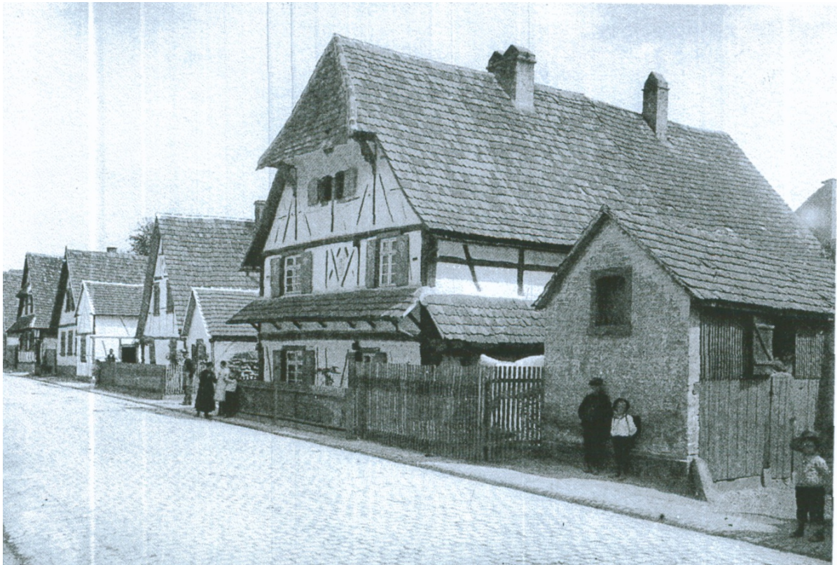
Gepflasterte Litzhardtstraße mit Fachwerkhäusern und alten Abflussgräben um 1910. 2