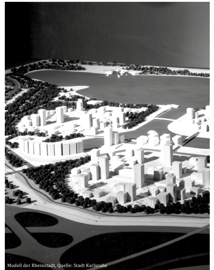
Modell der Rheinstadt, Quelle: Stadt Karlsruhe

http://www.karlsruhe.de/b1/stadtgeschichte/chronik/?epoche=196%25&title=Die%20Jahre%201960%20bis%201969 , Zugriff, 16.09.12