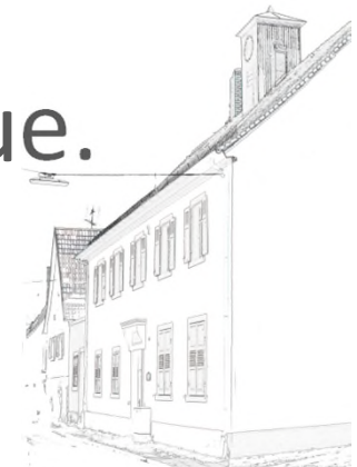
BEREICH RATHAUS WESTMARKSTRASSE

Schaffung eines identitätsstiftenden Dorfplatzes in der historischen Dorfmitte von Aue.